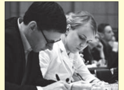
Landesparteitag in Arbeitsatmosphäre

Die Beschlüsse des Parteitages, Videos zur Rede von Holger Zastrow, Medienresonanzen und Fotos vom Parteitag finden Sie auf der Sonderseite unter www.fdp-sachsen.de