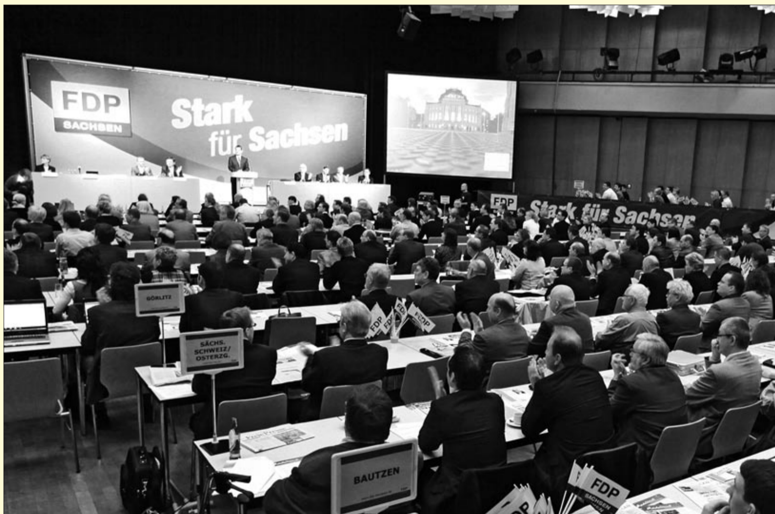
„Sachsen fit für 2020 machen“ – Zustimmung von den 220 Delegierten in Chemnitz

heißt es in dem Beschluss. Den Unternehmen im Freistaat macht die FDP Sachsen dennoch ein interessantes Angebot: Freiheit statt Geld. Statt Subventionen bietet die FDP weniger Bürokratie, weniger Regulierung und mehr Raum für unternehmerische Freiheit.