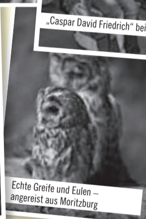
Echte Greife und Eulen – angegeist aus Moritzburg