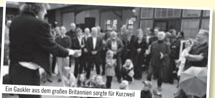
Ein Gaukler aus dem großen Britannien sorgte für Kurzweil