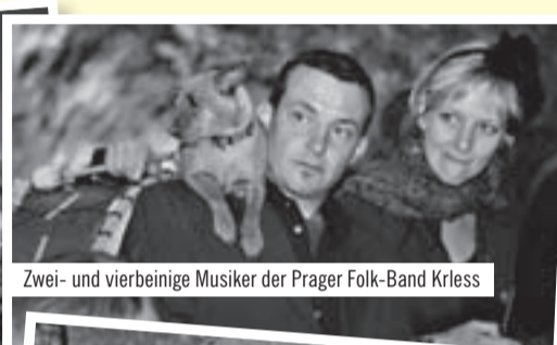
Zwei- und vierbeinige Musiker der Prager Folk-Band Krless