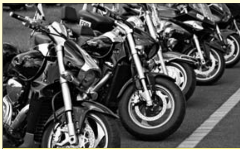
Bereit zur Abfahrt: Die heißen Öfen der FDP-Sachsen-Motorradtour

Pünktlich mit den Sommerferien begibt sich die sächsische FDP auf Reisen: Rund zwei Dutzend Städte in ganz Sachsen stehen auf dem Tourplan der mittlerweile sechsten