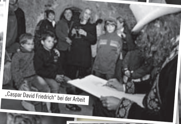
„Caspar David Friedrich“ bei der Arbeit