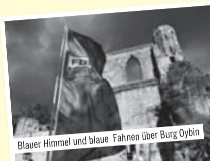
Blauer Himmel und blaue Fahnen über Burg Oybin

Der Film zum Fest und weitere Bilder unter www.liberales-burgfest.de