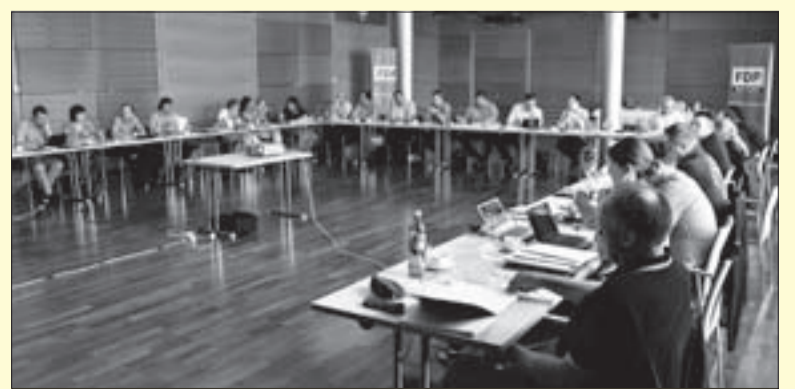
Inzwischen Tradition: Landesvorstandsklausur in Bad Schandau

einmal mit der Beratung von einigen Vorschlägen zu betrauen. Im Frühjahr 2012 soll dann ein Landesparteitag über die weitere Strategie bei der Staatsmodernisierung entscheiden. Auf der Klausur wurde zudem die Aufgabenverteilung im neuen Landesvorstand festgelegt. Weitere Themen waren die Strategie der Landespartei bis 2013/2014 sowie die Verbesserung der Parteiarbeit mit Blick auf Kommunikation, Veranstaltungen und Einbeziehung der Mitglieder.