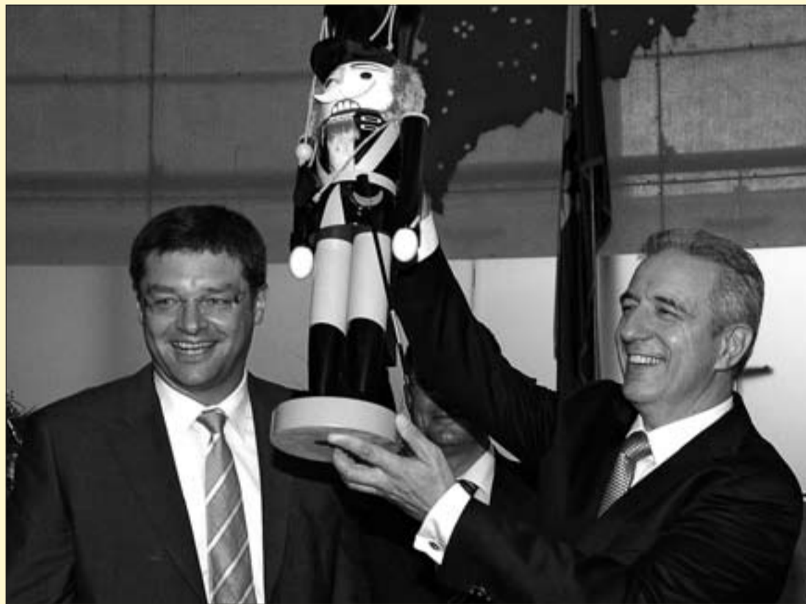
Geschenk mit Symbolwert: Schwarz-gelber Nussknacker als Geschenk der FDP an Ministerpräsident Tillich zur Wiederwahl

Einer der größten Erfolge der FDP in den Koalitionsverhandlungen ist schließlich die tiefgreifendste Schulreform seit der Wende: Endlich werden Schüler mit einer Bildungs-