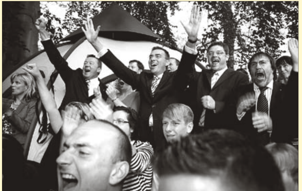
Jubel nach der 18.00 Uhr-Prognose im Garten des Liberalen Hauses

Jubel und nicht enden wollender Applaus im Garten des Liberalen Hauses waren die Folge. Auch das sächsische Ergebnis kann sich sehen lassen. Mit 13,3 Prozent im Freistaat gab es auch hier noch einmal satte Zugewinne gegenüber 2005. Damals bereits hatte der sächsische FDP-Landesverband mit 10,2 Prozent ein hervorragendes Ergebnis eingefahren.