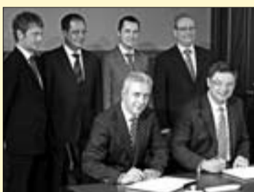
Unterzeichnung des Koalitionsvertrages durch Stanislaw Tillich (CDU), Holger Zastrow (FDP)

Am 22. September haben Stanislaw Tillich für die CDU und Holger Zastrow für die FDP den ersten Koalitionsvertrag der beiden Parteien in Sachsen unterzeichnet: „Freiheit. Verantwortung. Solidarität. Gemeinsam für ein starkes und selbstbewusstes Sachsen.“ Die FDP stellt nun in der Staatsregierung mit Sven Morlok den stellvertretenden Ministerpräsidenten und Wirtschaftsminister und mit Dr. Jürgen Martens den Justiz- und Europaminister, der zudem für den Bereich Staatsmodernisierung zuständig ist (mehr zu unseren Ministern auf Seite 5).