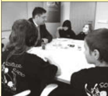
Die Jungreporter fragen nach

Auf Initiative von Flöhas FDP-Stadtrat André Quaiser besuchten sechs Dritt- und Viertklässler aus der Flöhaer Schiller-Grundschule im November den Sächsischen Landtag. Die Mitglieder der Arbeitsgemeinschaft Schüllerradio „Schillerwelle“ beobachteten dabei die laufende Plenardebatte von der Besuchertribüne des Landtages aus. Im Anschluss daran trafen sich die Nachwuchsreporter mit FDP-Fraktionschef Holger Zastrow zum Interviewtermin. Rund eine Stunde lang beantwortete der FDP-Politiker dabei die Fragen der Grundschüler, beispielsweise, welche Ausbildung man braucht, um Politiker zu werden, welche Aufgabe der Dresdner Landtag hat oder auch wozu man Parteien in Deutschland benötigt.