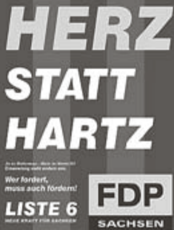
FDP-Plakat von 2004

Union und FDP haben auf Bundesebene beschlossen, das Schonvermögen für Hartz-IV-Empfänger zu erhöhen und selbstgenutzte Immobilien vor dem Zugriff des Staates zu schützen. Damit wird eine langjährige Forderung der sächsischen FDP umgesetzt. Schon im Jahr 2004 hatte die FDP im Freistaat Korrekturen an der Agenda 2010 gefordert und mit dem Plakat „Herz statt Hartz“ klar öffentlich Position bezogen. „Wir haben die unter Rot-Grün beschlossene herzlose Hartz-IV-Reform mit ihren vielen ungerechten Regeln immer kritisiert, denn gerade in Ostdeutschland sind viele ältere Menschen nach jahrzehntelanger Arbeit oft unverschuldet in die Arbeitslosigkeit gerutscht“, betont FDP-Landeschef Holger Zastrow.