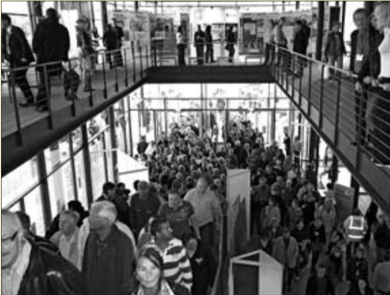
Ansturm: rund 7.000 Sachsen kamen am Nationalfeiertag in den Landtag