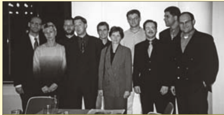
Mitglieder des Landesvorstandes 1999