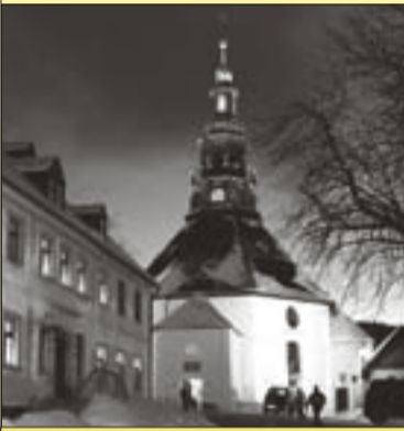
Die Seiffener Kirche

Der Kreisverband Erzgebirge lädt herzlich zur diesjährigen Liberalen Weihnacht am 12. Dezember nach Seiffen ein. Es ist mittlerweile schon seit 18 Jahren Tradition, dass die sächsischen Liberalen vor Weihnachten im meist verschneiten Erzgebirge zusammenkommen, um das politische Jahr gemeinsam ausklingen zu lassen. Zwischen 15.30 und 17.00 Uhr ist die Große Bergparade mit Lebendigem Spielzeug zu bestaunen, ab 19 Uhr findet die Liberale Weihnacht im „Landhotel Zu Heidelberg“ statt. Anmeldungen im FDP-Erzgebirgsbüro unter Tel. 037360/793 72 oder per E-Mail info@fdp-erz.de www.fdp-erz.de