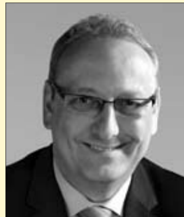
Dr. Jürgen Martens MdL Staatsminister der Justiz und für Europa

Seine politische Laufbahn begann mit dem Eintritt in die FDP 1976 und die Deutschen Jungdemokraten 1983. Bereits vom Januar 1990 an pflegte Dr. Martens regelmäßig Kontakte zu den Jungliberalen in