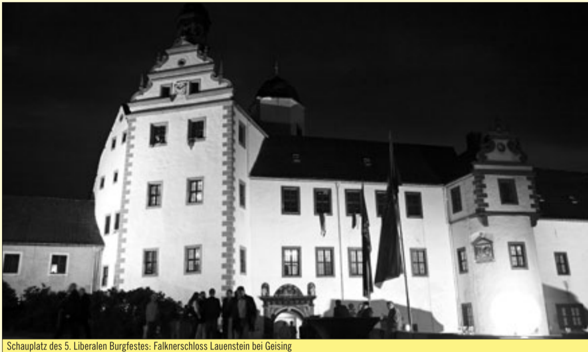
Schauplatz des 5. Liberalen Burgfestes: Falknerschloss Lauenstein bei Geising

Gelegenheit, mit den Abgeordneten und Mitarbeitern der Fraktion und den FDP-Vertretern aus der Staatsregierung in zwangloser und familiärer Atmosphäre ins Gespräch zu kommen.