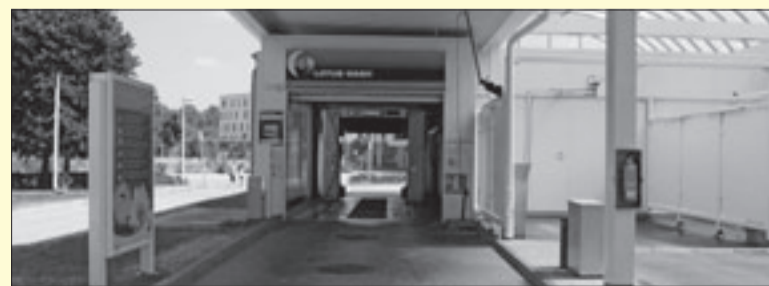
Bald Vergangenheit: Geschlossene Autowaschanlagen am Sonntag

Aber auch dieser besondere Warenkorb darf nicht an gesetzlichen Feiertagen feil geboten werden. Bislang gilt ein absolutes Verkaufsverbot an zehn Tagen, nach dem Gesetzentwurf der CDU/FDP-Koalition nur noch an fünf Tagen, nämlich Karfreitag, Ostermontag, Pfingstmontag sowie beiden Weihnachtsfeiertagen.