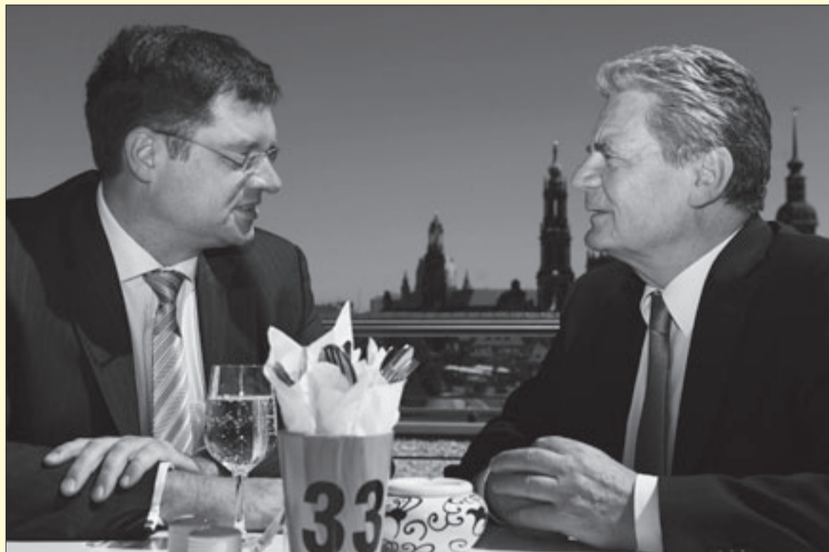
Vier-Augen-Gespräch im Dresdner Landtag: FDP-Landes- und Fraktionschef Holger Zastrow und Kandidat Joachim Gauck

Während das Ergebnis die einen in der Partei jubeln lies, war es für die anderen eine Enttäuschung. „Wir wollten, dass Joachim Gauck