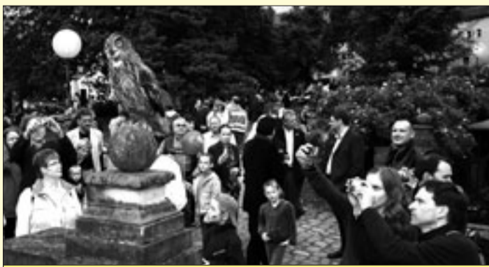
Zog die Besucher in seinen Bann: Uhu Barnie