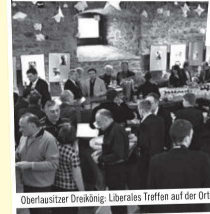
Oberlausitzer Dreikönig: Liberales Treffen auf der Ortenburg in Bautzen