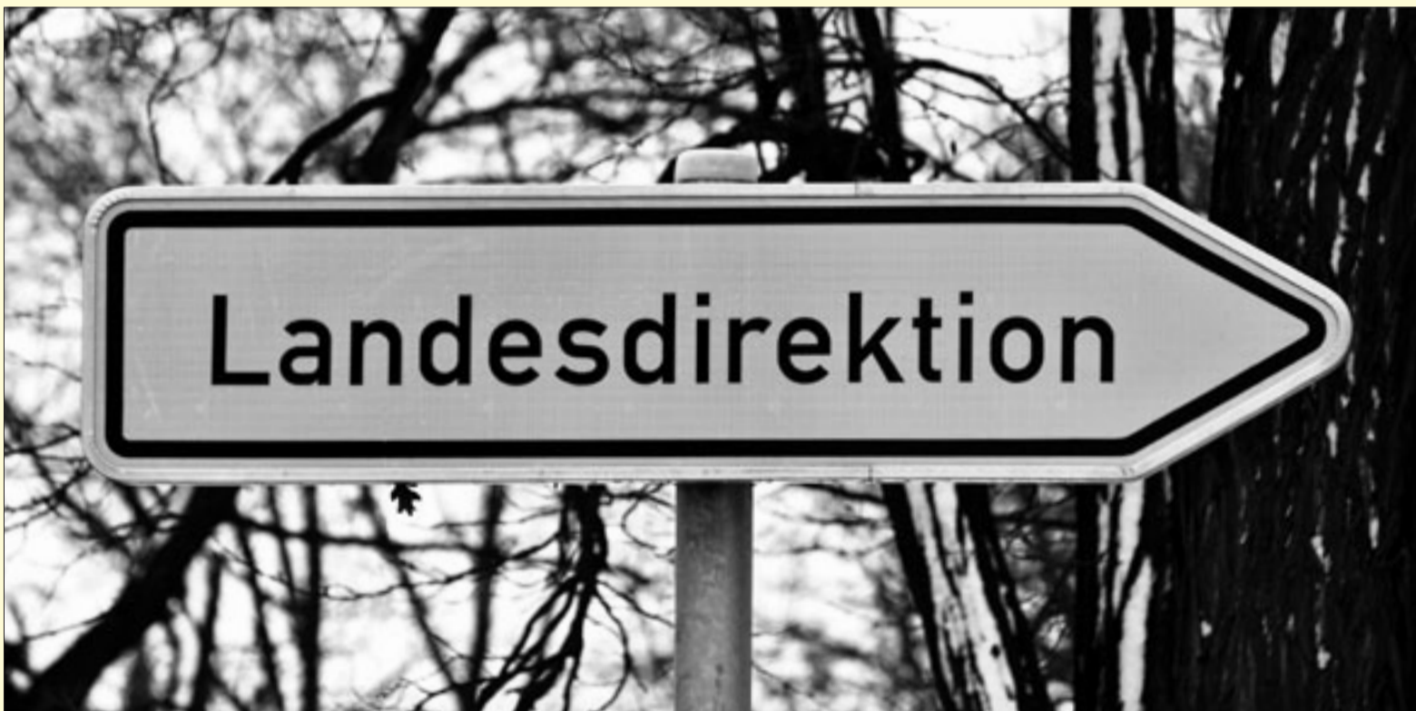
Koalition mit klare Richtungsvorgabe: Sachsens Verwaltung wird umgebaut. Unter anderem wird aus drei Landesdirektionen eine.

schließlich in den Großstädten zu konzentrieren, dezentralisieren wir die Verwaltung in die Regionen hinein, stärken den ländlichen Raum und Wachstumskerne außerhalb Dresdens, Leipzig, Chemnitz wie zum Beispiel Görlitz, Bautzen, Freiberg, Pirna, Zwickau und Grimma“, verweist der FDP-Fraktionschef auf die liberale Handschrift.