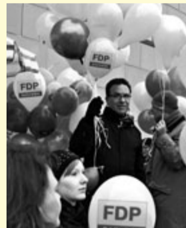
Tausend bunte Ballons an der Synagoge statt brauner Aufmarsch