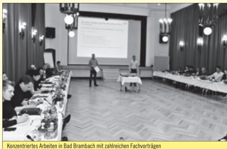
Konzentriertes Arbeiten in Bad Brambach mit zahlreichen Fachvorträgen

Landtagsfraktion beriet die strategische Planung 2011