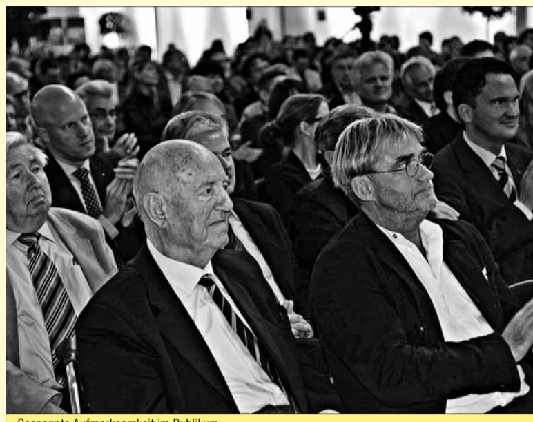
Gespannte Aufmerksamkeit im Publikum

Veranstaltungszentrum „Zeitenströmung“ gekommen und erlebten einen emotionalen Rückblick auf 20 Jahre FDP hier in Sachsen.