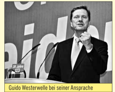
Guido Westerwelle bei seiner Ansprache

und Vizeregierungschef persönlich gekommen, um den Sachsen zu ihrem 20-jährigen Jubiläum zu gratulieren. Zum Schluss seiner Rede betonte Westerwelle, was wohl kaum ein FDP-Landesverband so gut versteht wie die Freidemokraten in Sachsen mit ihrer wechselvollen Geschichte: „In der Politik kommt es darauf an: Mut zu haben, einen klaren Kompass, starke Nerven und auch gegen Widerstand stehen zu bleiben.“