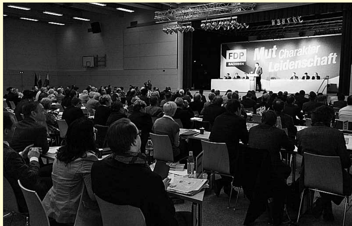
Reformationspartei in Hartha: rund 200 Delegierte in der HarthArena

nicht so schlecht aus. Als Beispiele nannte Zastrow den schuldefizienten Haushalt, den Systemwechsel bei den Abgeordnetenfraktionen, das Ladenöffnungsgesetz und zahlreiche Maßnahmen zur Entbürokratisierung. Und mit Blick auf die öffentliche Kritik im ersten Regie-