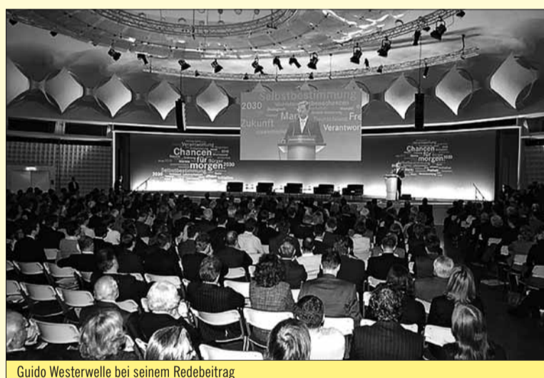
Guido Westerwelle bei seinem Redebeitrag

Der Kongress in Berlin ist aber nur der Auftakt. Durch zahlreiche Regionalkonferenzen und Arbeitskreise auf lokaler Ebene soll das Wissen aller Mitglieder der FDP einfließen. Auch im KV Görlitz werden wir die Entwicklung der neuen Liberalen Leitlinien aktiv begleiten. Wir er-