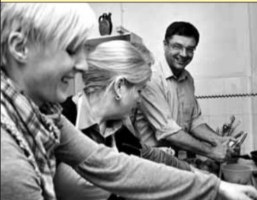
Alle Mann an die Kartoffeln!