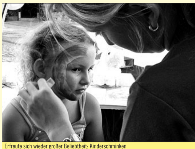
Erfreute sich wieder großer Beliebtheit: Kinderschminken