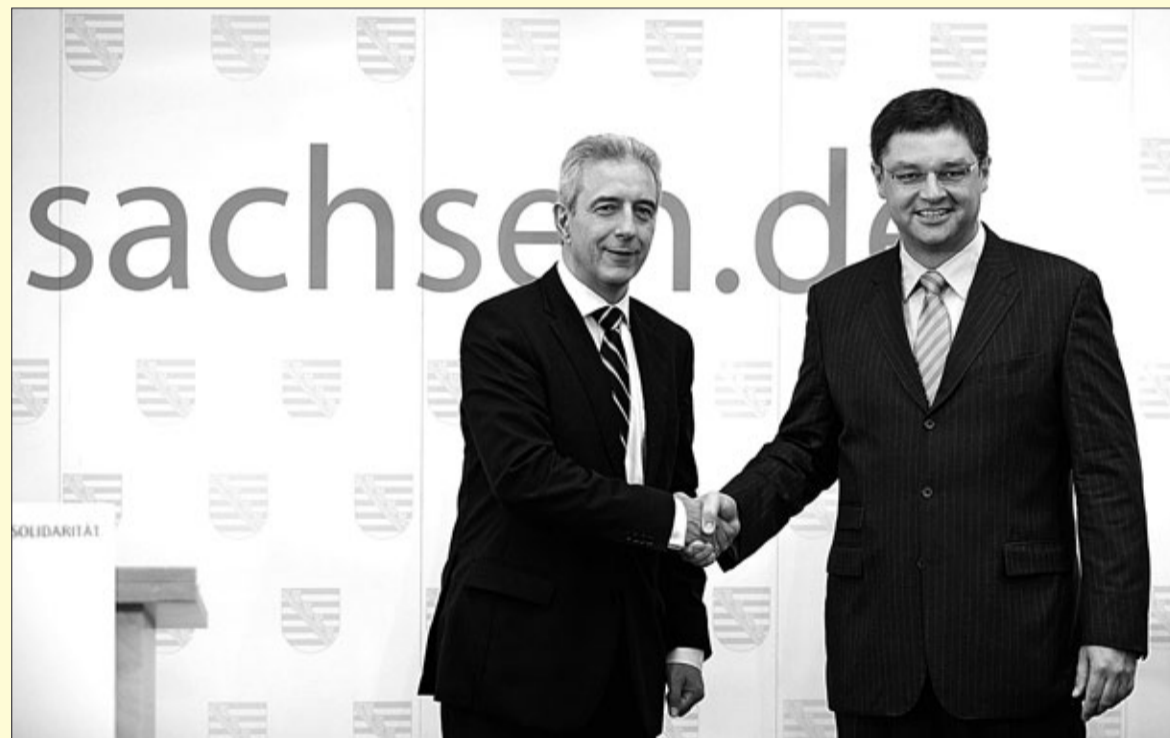
Bürgerliches Bündnis in Sachsen auf gutem Fundament – Stanislaw Tillich (CDU), Holger Zastrow (FDP)

Und wie sieht es mit der Partei selbst aus? „Wir sind schwer in Tritt gekommen und haben auch Fehler gemacht. So eine Regierungsbeteiligung schüttelt man nicht so einfach aus dem Ärmel; noch dazu wenn man eine so große Aufgabe zum ersten Mal übernimmt. Aber inzwischen haben wir uns gefangen, sind personell aufgestellt und gewinnen an Durchsetzungskraft und Profil. Natürlich sind wir noch nicht dort, wo wir hinwollen, und wir brauchen die Unterstützung und die Toleranz unserer Basis weiterhin. Wir haben jedoch nach dem politisch etwas wilden ersten Halbjahr direkt nach der Landtagswahl das Ziel wieder im Blick und kennen den Weg dorthin. Wenn wir die Verhandlungen zum nächsten Doppelhaushalt als Feuertaufe für die Reformbegeisterung und die Einigkeit der Dresdner Koalition bestehen, ist der Weg frei für liberale Herzensprojekte wie die Staatsmodernisierung, die Oberschulreform und die Profilierung Sachsens als Aufsteiger unter den Bundesländern und Motor für gesellschaftliche Veränderungen in Deutschland.“