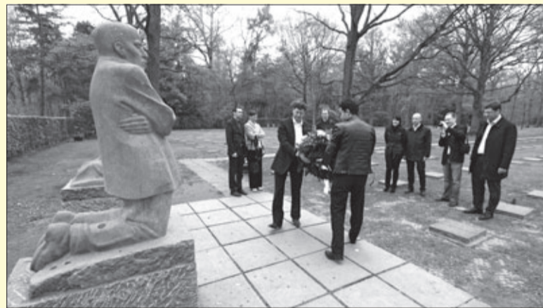
Sächsische Delegation bei der Kranzniederlegung am Kollwitz-Denkmal

Kranz im Gedenken an die gefallenen Soldaten des Ersten Weltkrieges nieder. Holger Hase sprach anschließend das Totengebet. Der deutsche Soldatenfriedhof Vladslo ist mit fast 25.650 Gräbern einer von vier Ehrenfriedhöfen in der Provinz Westflandern. Der Volksbund übernahm 1954 im Auftrag der Bundesregierung den Ausbau und die Pflege dieser Friedhöfe. Tritt man durch den Eingangsbau, blickt man im Hintergrund auf die Figurengruppe „Trauerndes Elternpaar“ von Käthe Kollwitz. Das Kunstwerk gehört zu den bekanntesten Friedhofskunstwerken und zieht jährlich etwa 50.000 Besucher an.