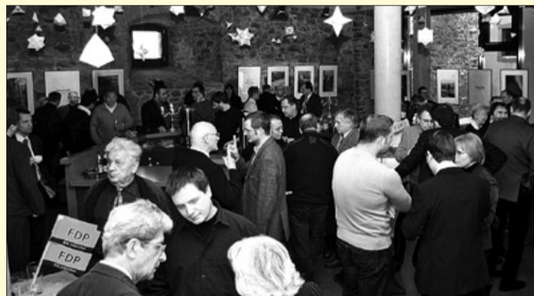
Neujahrsempfang der FDP Bautzen auf der Ortenburg

„2009 war das erfolgreichste Jahr in der Geschichte der FDP in Sachsen. In Europa, im Bund, im Land und in unseren Kommunen - wir haben auf allen Ebenen Rekordergebnisse erzielt. Und wir liegen in Sachsen als FDP mit der SPD auf Augenhöhe.