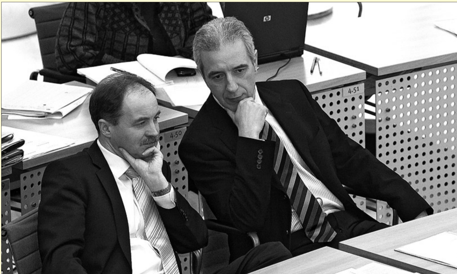
Gemeinsam für Sachsen auf der Regierungsbank: Stanislaw Tillich (CDU) und Sven Morlok (FDP)

Modells der Oberschule, welches endlich ein längeres gemeinsames Lernen mit einer zweiten Bildungsempfehlung nach der 6. Klasse ermöglichen wird – die bisher umfassendste Reform des sächsischen Schulsystems.