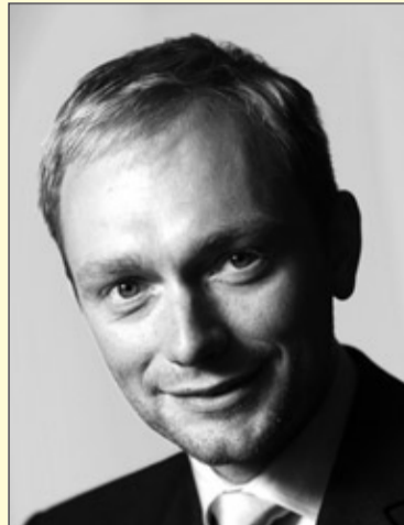
Christian Lindner Generalsekretär der FDP

Mit Spannung erwartet werden dürfte die Rede des neuen FDP-Generalsekretärs Christian Lindner, der seine Teilnahme zugesagt hat. Dar-