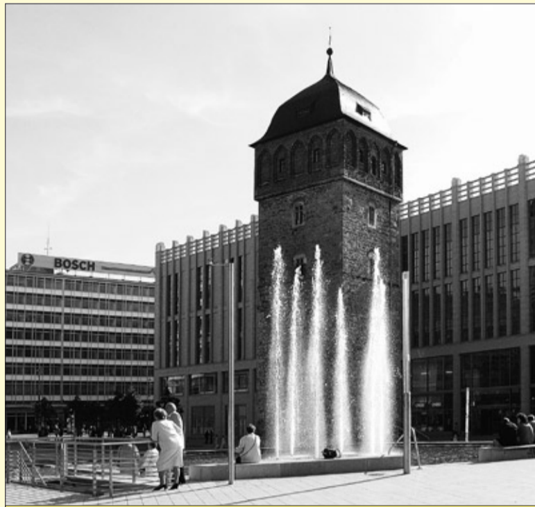
Roter Turm, Chemnitz

Ausführliche Informationen zum Landesparteitag im Internet unter www.fdp-sachsen.de