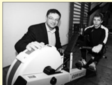
Übergabe eines Trainingsergometers für den Ruderverein Dresden-Laubegast

Beschluss plötzlich aufschieben. „Linke, SPD und Grüne führen un-